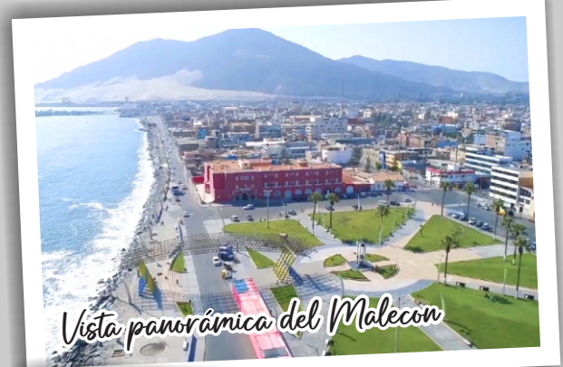
Vista panorámica del Malecón

El malecón Grau es parte del City Tours de Chimbote, su arquitectura moderna tiene un significado muy interesante asociada a la actividad pesquera de Chimbote. Es un mirador y observatorio de la Bahía de Chimbote en forma de un dique con un enrocado artificial para la protección de la ciudad ante los oleajes anómalos. Desde él, se visualiza a la Isla Blanca y demás islas, embarcaciones pesqueras y las aves guaneras. Su arquitectura desde la Plaza Grau hasta Huanchaquito simboliza un esqueleto de pescado, conformada por farolas que representan las espinas de pescado, la cabeza construida en una pequeña plazuela, se ubica en el barrio Huanchaquito y es a la vez un mirador, para terminar la cola en la Plaza Grau.