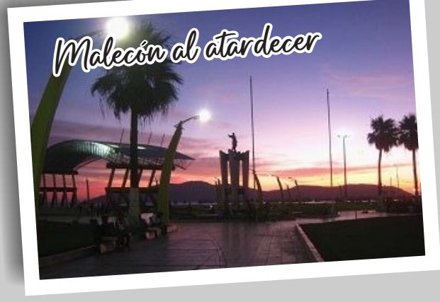
Malecón al atardecer