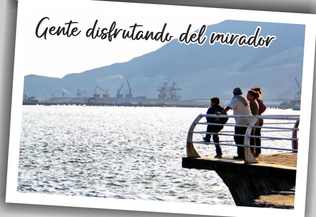
Gente disfrutando del mirador